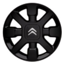
Lichtmetaal 17" Diamantée 'CROSS BLACK' 205/50 R17T