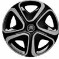
Staal 16" + wielplaat 'STEEL & STYLE 3D' 205/55 R16T