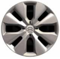
Staal 15" + wielplaat 'WHALETAIL' 185/65 R15T