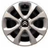
Staal 15" + wielplaat 'ARROW' 195/65 R15T