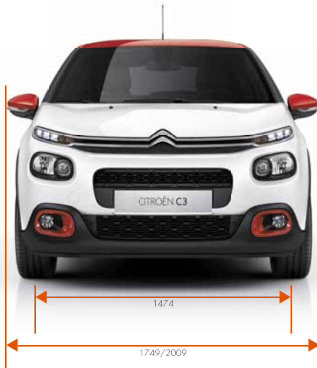
Breedte / Breedte met uitgeklapte buitenspiegels