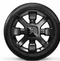
Lichtmetaal 17" CROSS BLACK 205/50 R17V