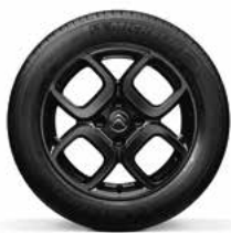
Lichtmetaal 16" SQUARE BLACK 205/55 R16V