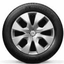
Staal 16" wielplaat CORNER 205/55 R15T