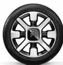
Lichtmetaal 17" CROSS 205/50 R17V