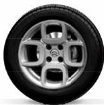
Lichtmetaal 16" SQUARE GREY 205/55 R16V